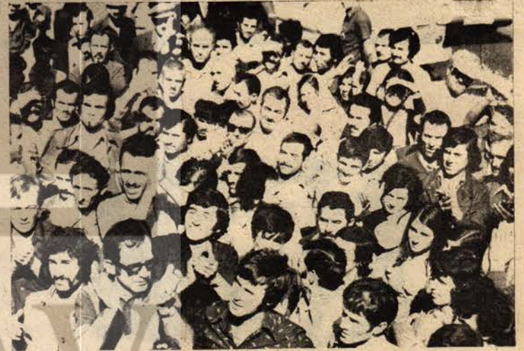
Orta çağdan kalma baskı ve sömürü metodlarına karşı direnişe geçen Tariş işçileri «faşist iktidar» «Bağımsız Türkiye» diye bağırıyor.

Alsancak üzüm işletmelerindeki direniş Pazartesi günü başladı. İşçilerin büyük bir çoğunluğu Besin-İş sendikasına üye olmuşlardı. O güne kadar isten atılan işçiler, fabrika önünde ba-