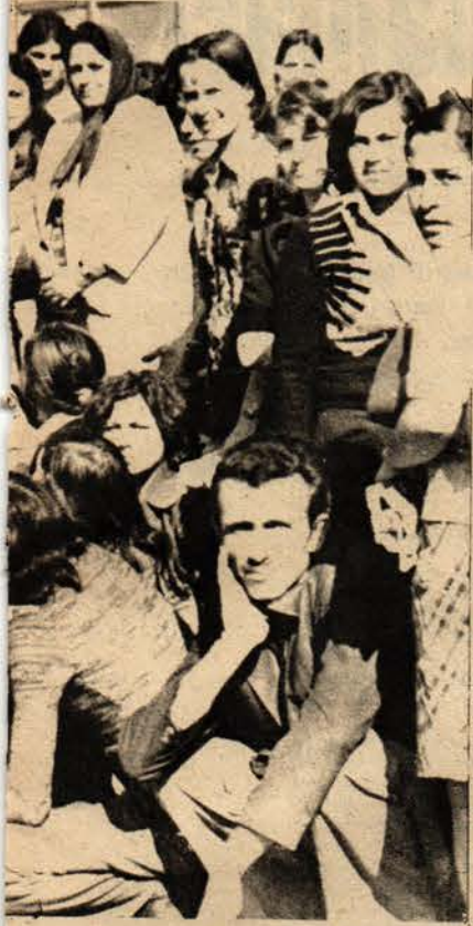
ççbalarına rağmen sürüyor.

«Ne Amerika Ne Rusya, Bağımsız Bioksuz Türkiye, Ülkelerin Bağımsızlığı, Milletlerin Kurtuluşu ve Halkların Devrimi İçin İleri, Kurtuluş Bizimdir.»